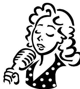
A Vera canta.