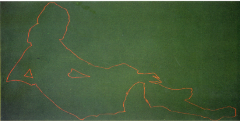
1 IN THE CAFÉ Plexiglas pintado